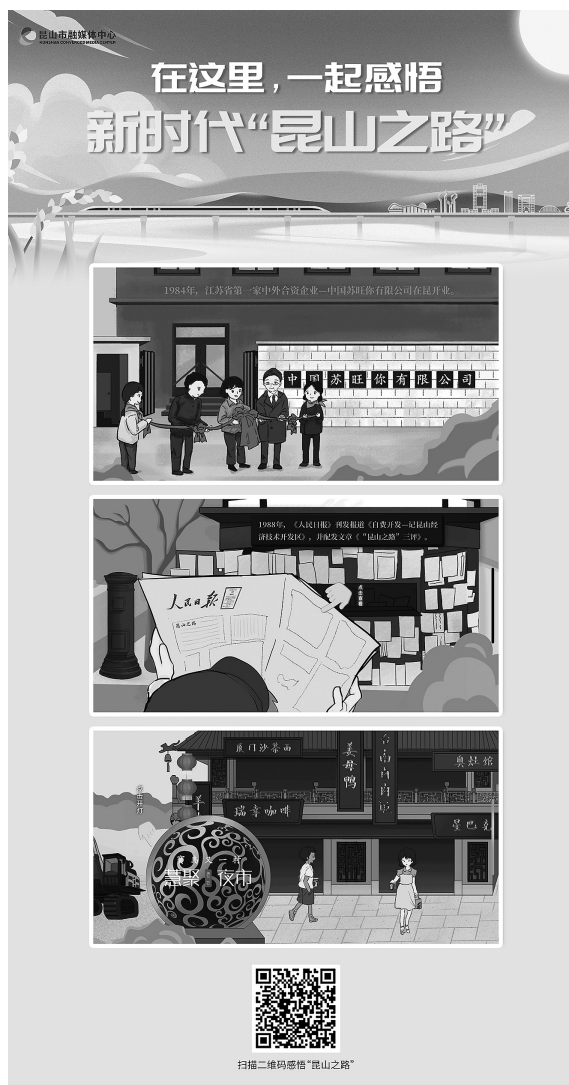
融媒创意产品《H5 在这里，一起感悟 新时代“昆山之路”》

北京人民大会堂，第一时间采访报道党的二十大盛况，“零距离”传回党的二十大声音，并向全国、全球讲好昆山故事。